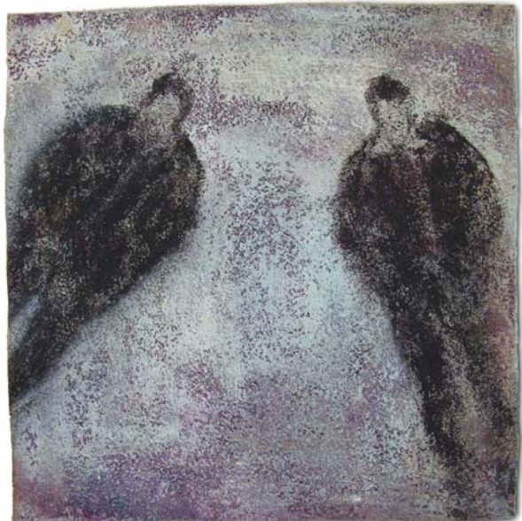
KAMEL YAHIAOUI Fenêtres anonymes Technique mixte sur tissu velours Ensemble de 70 peintures, 25 x25 cm unité 2006 Courtesy Kamel Yahiaoui Musée des Arts Derniers, Paris © Pascal Humbert