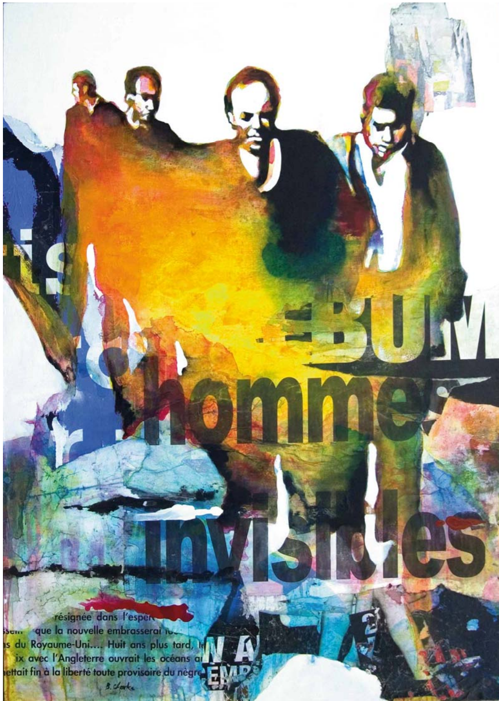
BRUCE CLARKE Hommes invisibles Collages et acrylique sur toile 2006 Courtesy Bruce Clarke Musée des Arts Derniers, Paris © Bruce Clarke