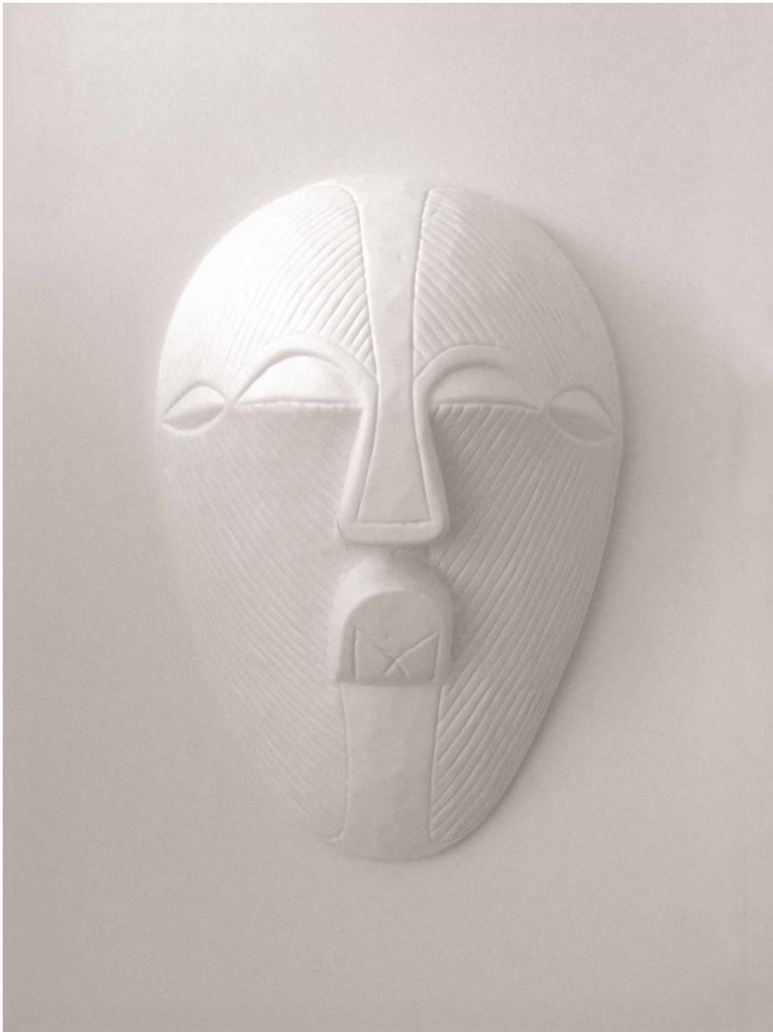
FRANCK SCURTI White memory Termoformage (1/3) 2006